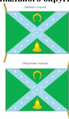
Рисунок флага Крестецкого муниципального округа Новгородской области